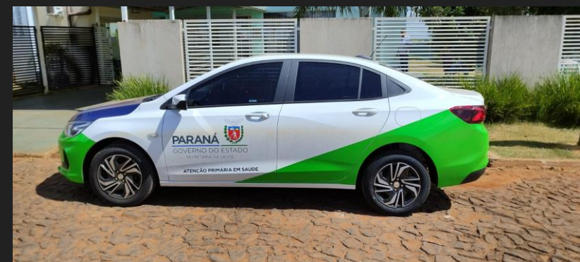
Foto original do veículo